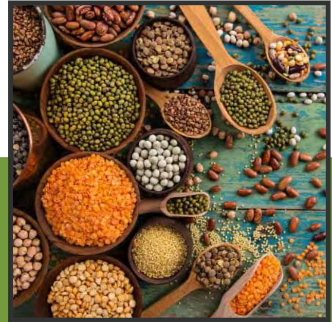
نوريد البقوليات المعلبة والجافة Supplying canned and dry legumes