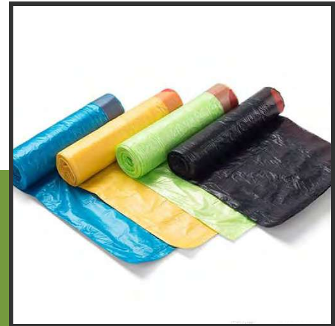
نوريد مواد وأدوات التغليف Supply of packaging materials and tools