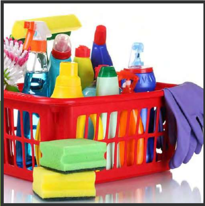
نوريد مواد وادوات النظافة Supply of cleaning materials and tools