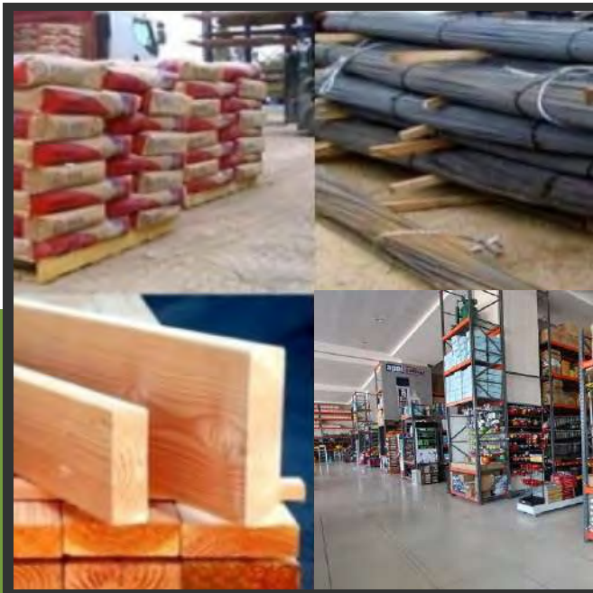
نوريد مواد وأدوات البناء والكهرباء Supply of building and electricity materials and tools